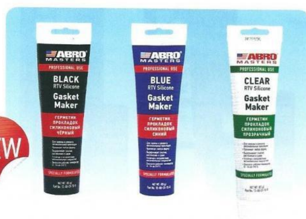
Герметик прокладок ABRO® Masters в мягкой тубе (чёрный, синий, прозрачный)

Заменяет большинство испорченных автомобильных прокладок. Легко принимает любую форму. Быстро застывает. Не подвержен растрескиванию, сжатию и вытеканию в ходе температурных циклов. После застывания сохраняет прочность и эластичность. Не разрушается маслами, водой, антифризом и трансмиссионными жидкостями. Особенности упаковки: • защита от подделок • экономное использование • высокая герметичность и прочность упаковки • привлекательный внешний вид • сохранение эластичности упаковки при минусовых температурах • равномерное и полное выдавливание