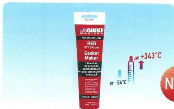
Герметик прокладок ABRO® Masters в мягкой тубе (красный)

Предназначен для ремонта и замены автомобильных прокладок, работающих при высоких температурах (до 343°C). Безопасен для автомобилей, оборудованных кислородными датчиками. Легко принимает любую форму. Быстро застывает. Не подвержен растрескиванию, сжатию и вытеканию в ходе температурных циклов. После застывания сохраняет прочность и эластичность. Устойчив к большинству автомобильных жидкостей. Особенности упаковки: • защита от подделок • экономное использование • высокая герметичность и прочность упаковки • привлекательный внешний вид • сохранение эластичности упаковки при минусовых температурах • равномерное и полное выдавливание